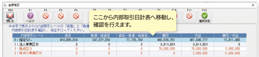
伝票入力 金額確認